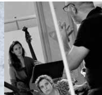
Musique des lumières