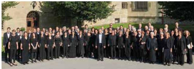
Chœur de chambre de l'Université de Fribourg

D'autre part, l'exemple de Johann Sebastian Bach, puissante figure tutélaire et modèle musical incontournable, aura forcément influencé Mendelssohn, lui-même devenu une figure centrale de la vie artistique de Leipzig. D'où le bon mot attribué à Berlioz: «Il n'y a qu'un Dieu à Leipzig, c'est Bach, et Mendelssohn est son prophète».