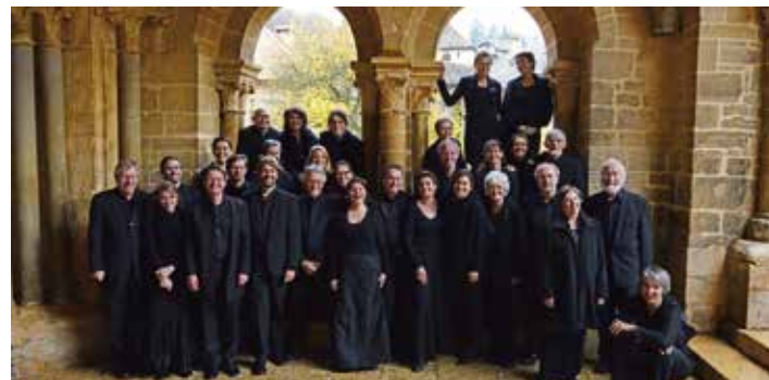
Les vocalistes romands

Quinze ans plus tard, pour une raison que l'on ignore, Bach reprit sa Messe et la compléta pour former un grand corpus respectant le schéma catholique. Il y ajouta ainsi un Credo, appelé Symbolum Nicenum, un Sanctus et un Agnus Dei. La plupart des nouveaux mouvements sont également des adaptations d'œuvres antérieures, à l'exception de trois pièces originales qui constituent peut-être le véritable testament musical du compositeur.